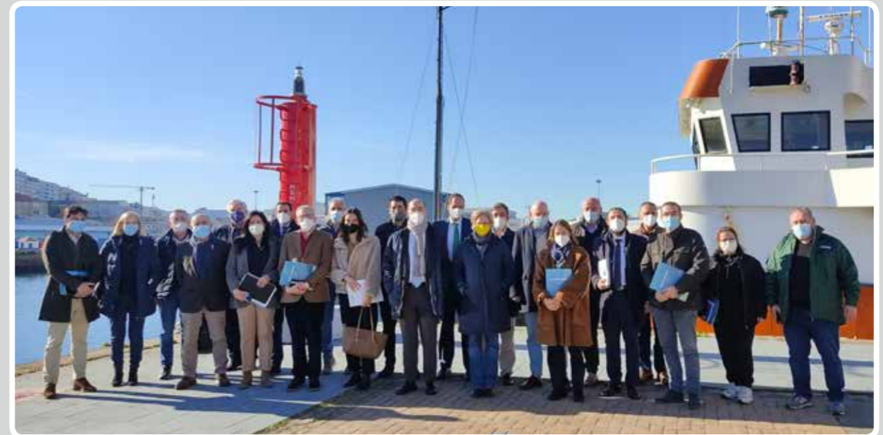
Reunión de la Comisión Blue Growth de pesca. / Meeting of the Blue Growth Fisheries Commission.