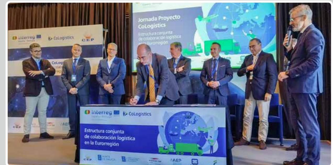
Firma del protocolo de intenciones para dar continuidad al proyecto europeo "CoLogistics".