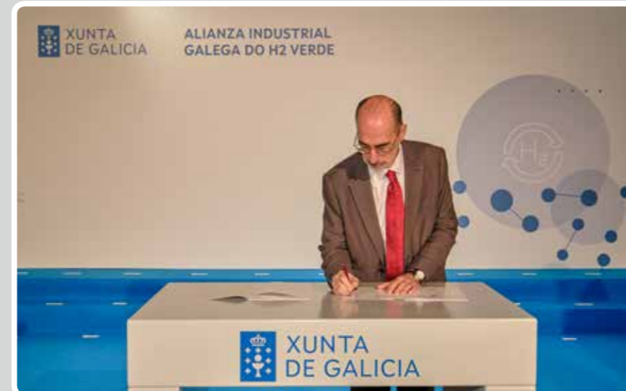
El Puerto de Vigo se adhiere a la Alianza Industrial Gallega del Hidrógeno Verde.