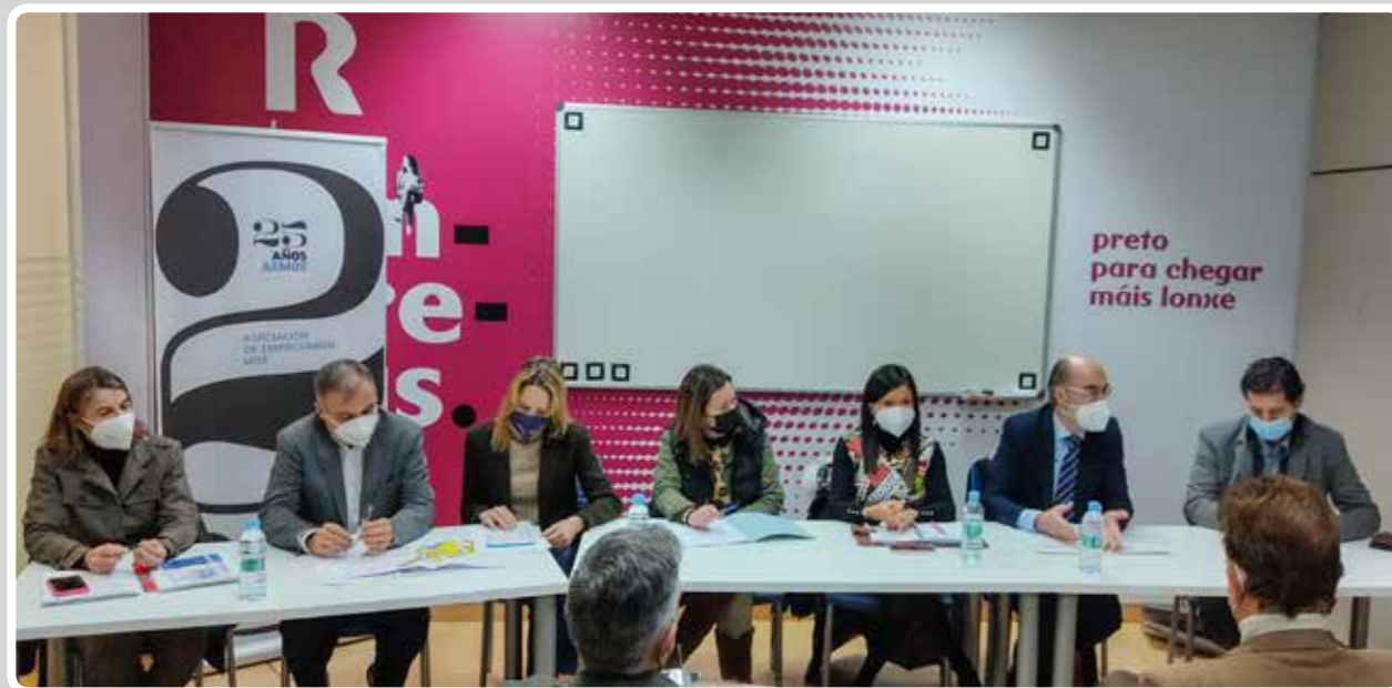
Reunión con la Asociación de Empresarios de Mos (AEMOS). Meeting with the Association of Entrepreneurs of Mos (AEMOS).