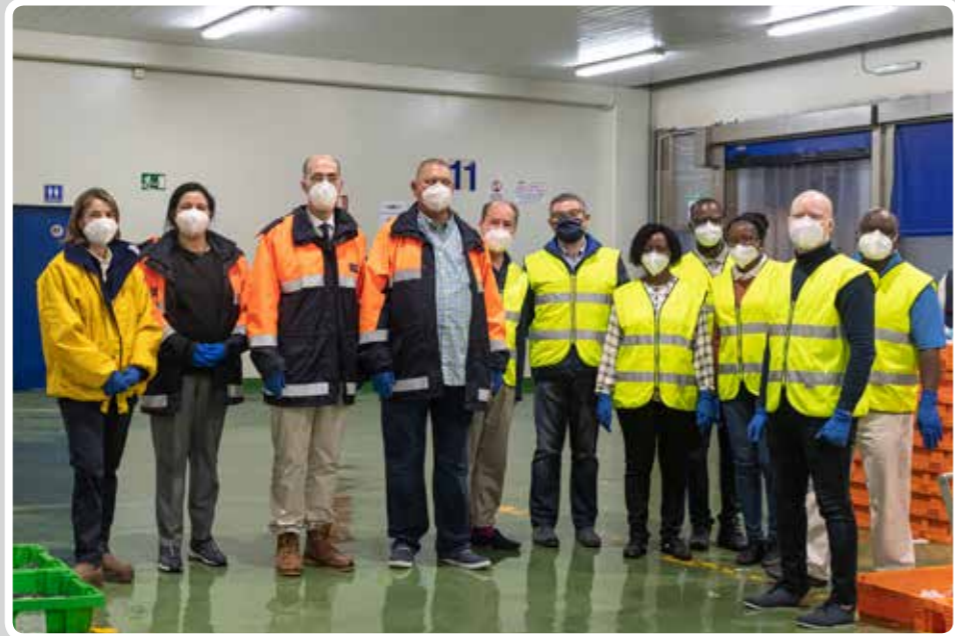
El ministro de Pesca y Recursos Marinos de Namibia, Derek James Klazen, visita el Puerto Pesquero de Vigo. The Minister of Fisheries and Marine Resources of Namibia, Derek James Klazen, visits the Fishing Port of Vigo.