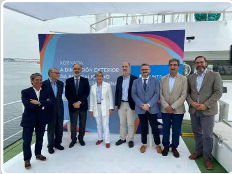
El Puerto de Vigo acoge una jornada sobre la Política Pesquera Común a bordo del "Golden Chicha". The Port of Vigo hosts a conference on the Common Fisheries Policy aboard the "Golden Chicha".