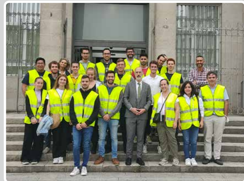
Visita de alumnos del Master de Comercio Internacional IESIDE. Visit of students of the Master of International Trade IESIDE.