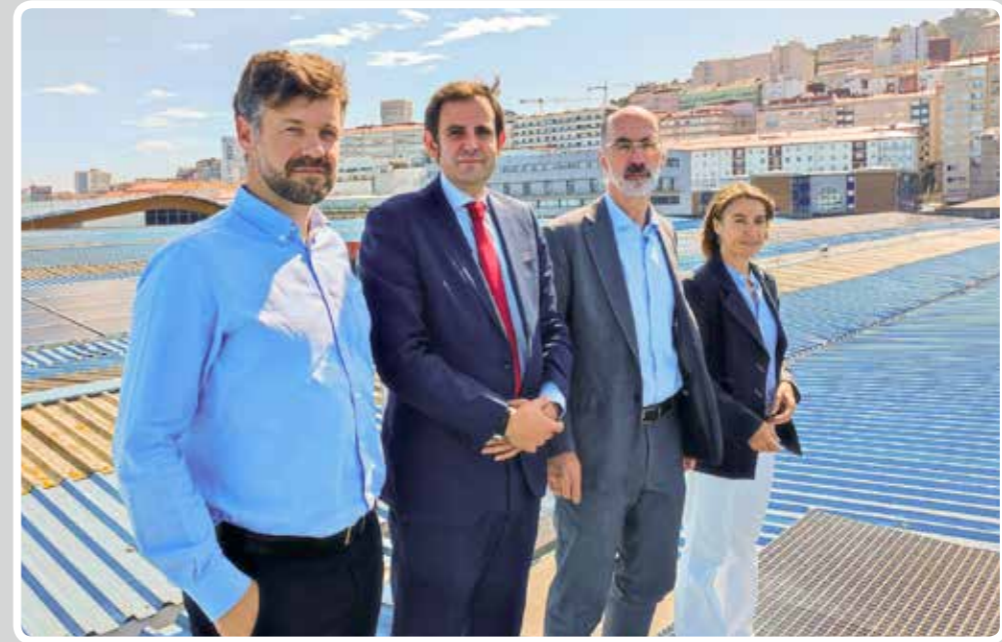
La Lonja del Puerto de Vigo se convierte en la primera de Europa en funcionar con energías renovables con almacenamiento. The Market at the Port of Vigo becomes the first in Europe to store and operate with renewable energy.