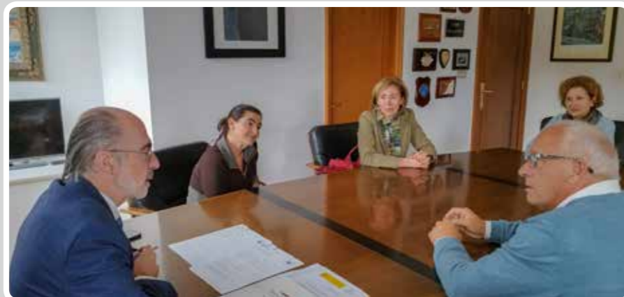
Firma de contratos de trabajadores de la APV.