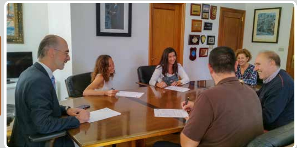
Firma de contratos de trabajadores de la APV. Signature of the Vigo Port Authority worker contracts.