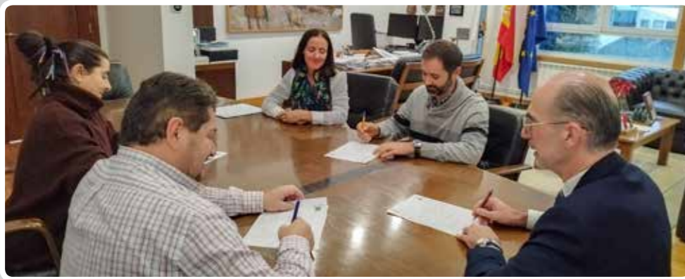
Firma de contratos de trabajadores de la APV.