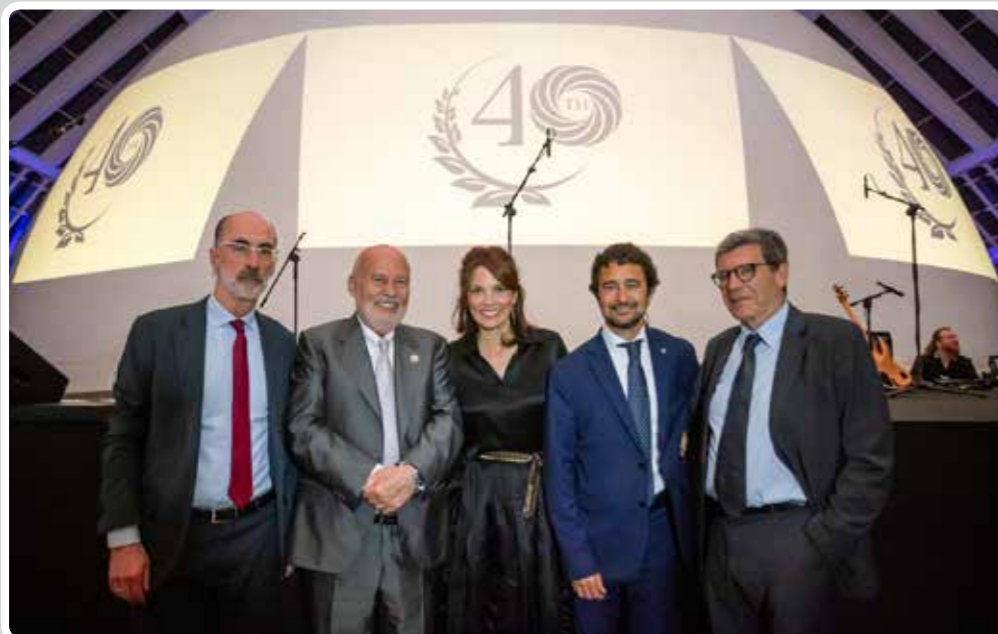
El Puerto de Vigo participa en los actos de celebración del 40 aniversario de MSC España.