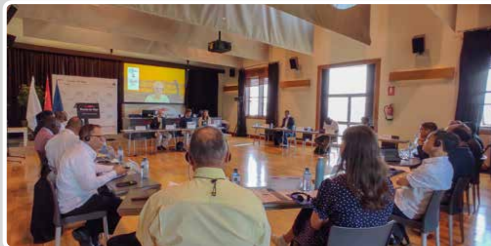
The FAO once again trusts the Port of Vigo to host its International Workshop on Blue Fishing Ports.