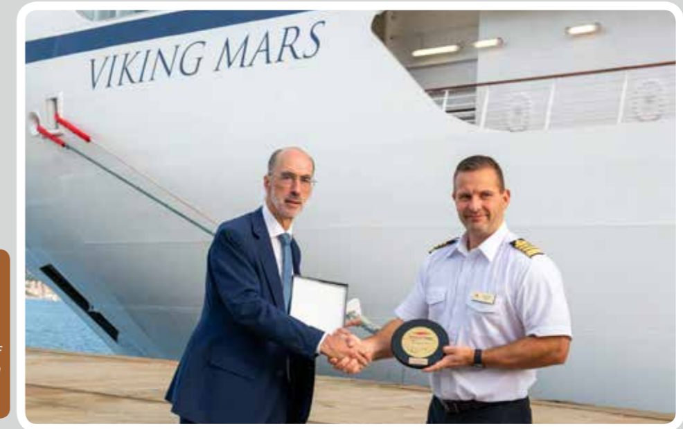
Escala inaugural del "Viking Mars" en el Puerto de Vigo. Inaugural call of the "Viking Mars" in the Port of Vigo.