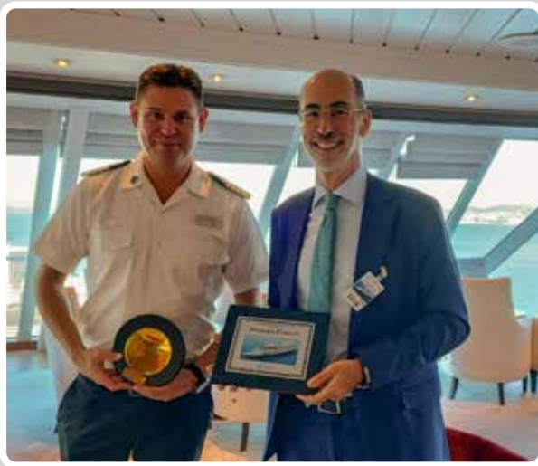
El Puerto de Vigo acoge la escala inaugural del Azamara Pursuit. The Port of Vigo hosts the inaugural stopover of the Azamara Pursuit.