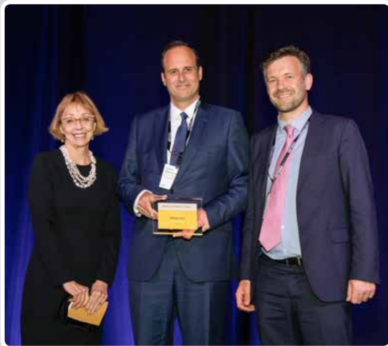
El Puerto de Vigo logra el "Óscar del Medioambiente" otorgado por la IAPH por el proyecto "Living Ports". The Port of Vigo wins the "Oscar for the environment" awarded by the IAPH for the "Living Ports" project.