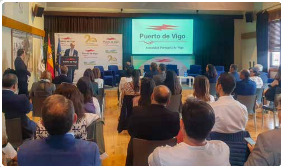
El Puerto de Vigo celebra el XX Aniversario de la web especializada InfoCruceros. The Port of Vigo celebrates the 20th anniversary of the specialized website InfoCruceros.