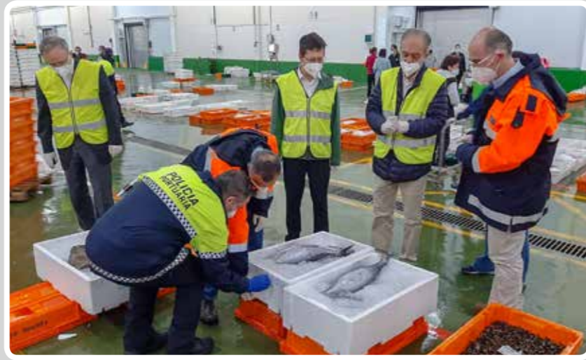
Visita del eurodiputado español y miembro de la Comisión de Pesca del Parlamento Europeo, Francisco Millán Mon, al Puerto de Vigo. Visit of the Spanish MEP and member of the Fisheries Committee of the European Parliament, Francisco Millán Mon, to the Port of Vigo.