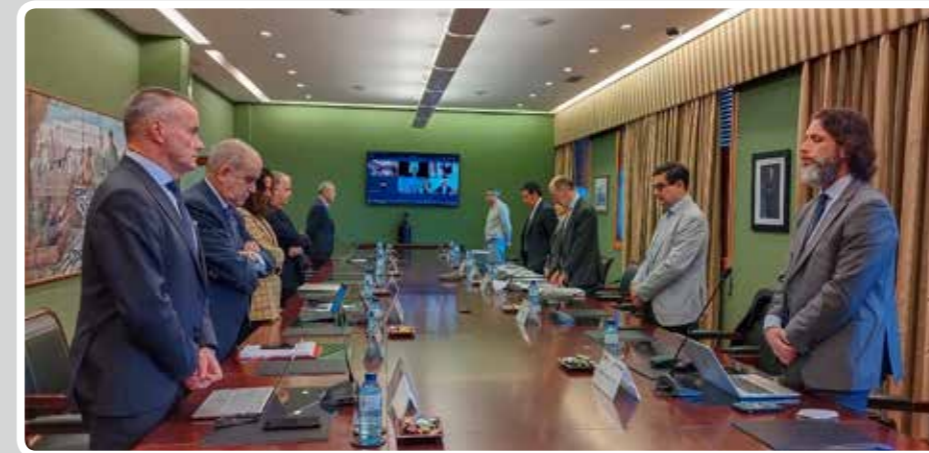
El Consejo de Administración de la APV guarda un minuto de silencio por el fallecimiento de un trabajador en el astillero Cardama.