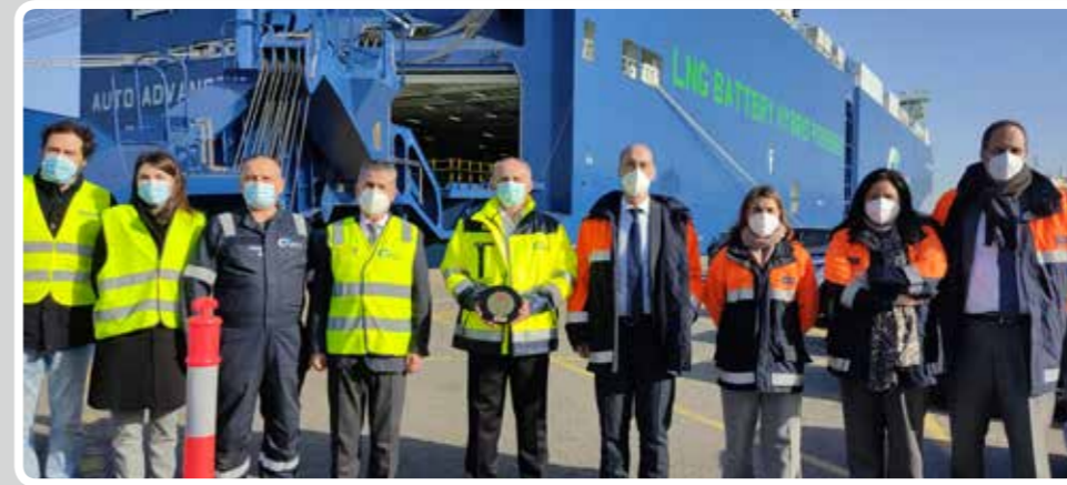
El Puerto de Vigo acoge la escala inaugural en España del "Auto Advance", el primer ro-ro híbrido del mundo. The Port of Vigo hosts the inaugural stopover in Spain of the "Auto Advance", the first hybrid Ro-Ro in the world.