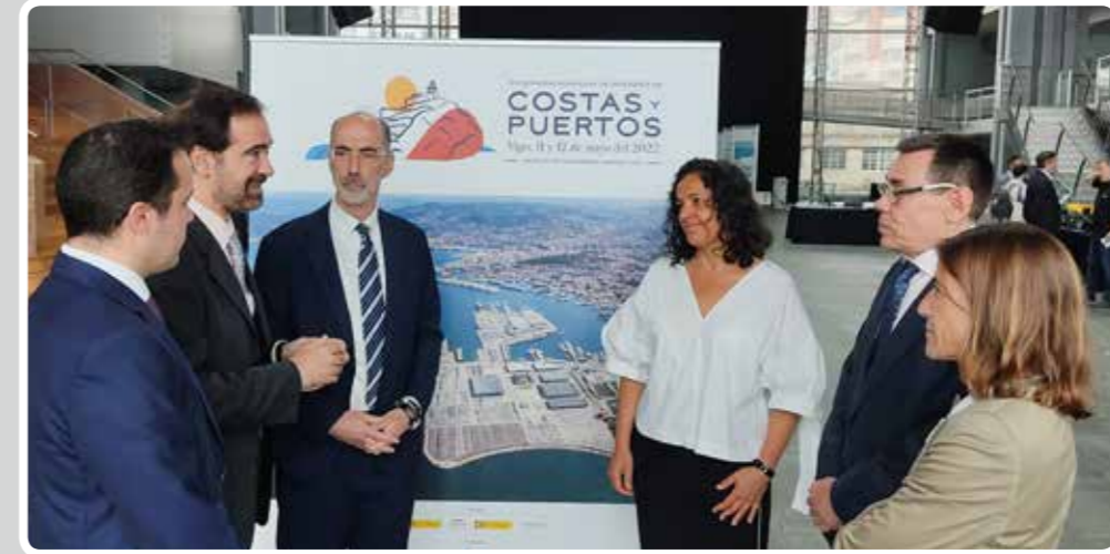
Inauguración de las Jornadas Españolas de Ingeniería de Costas y Puertos.