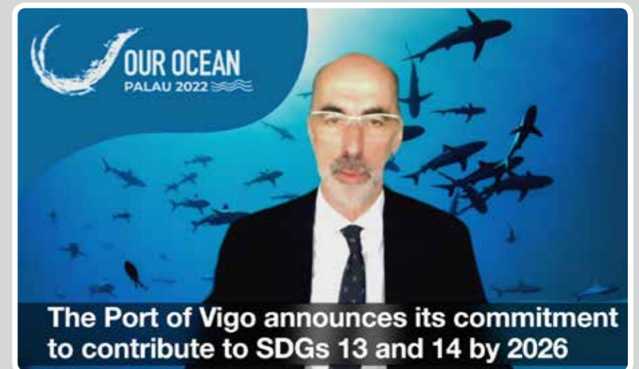
The Port of Vigo announces its commitment to contribute to SDGs 13 and 14 by 2026