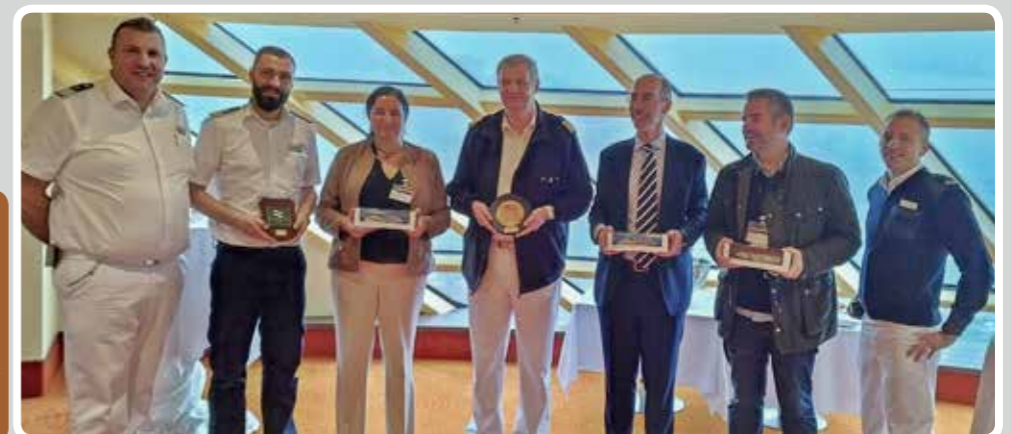
Inaugural stopover of the "Aida Bella" in the Port of Vigo.