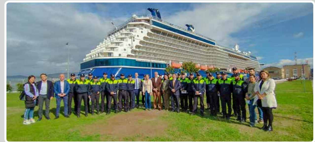
La primera promoción de la Policía Portuaria de Vigo se gradúa en defensa personal e intervención policial. The first class of the Port of Vigo Police graduated in self-defence and police intervention.