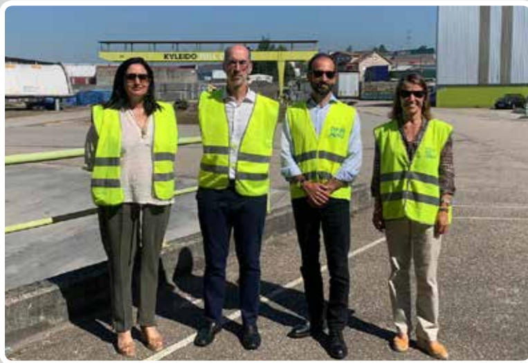
Visita a las instalaciones de Kaleido Ideas & Logistics en O Porriño y Vilanova de Cerveira. Visit the Kaleido Ideas & Logistics facilities in Porriño and Vilanova de Cerveira.