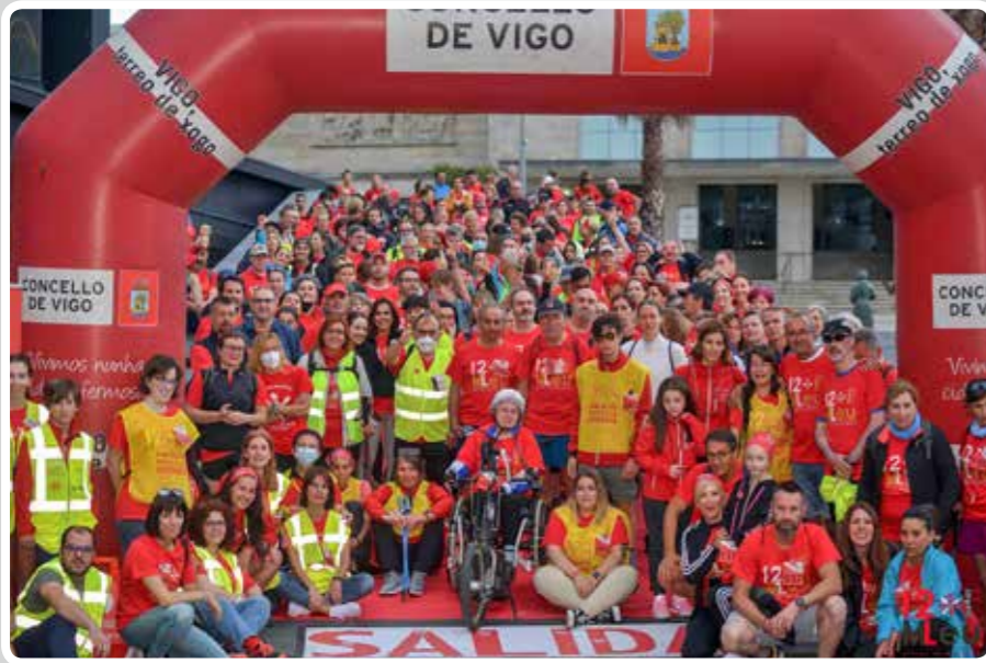
El Puerto de Vigo acoge la salida de la XIII Marcha contra la Leucemia. The Port of Vigo hosts the start of the XIII march against leukaemia.