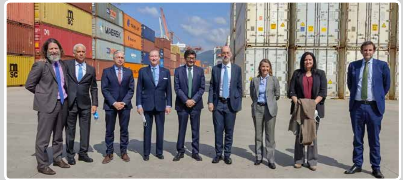
Visita del presidente de Puertos del Estado a la Terminal de Contenedores del Puerto de Vigo (Termavi).