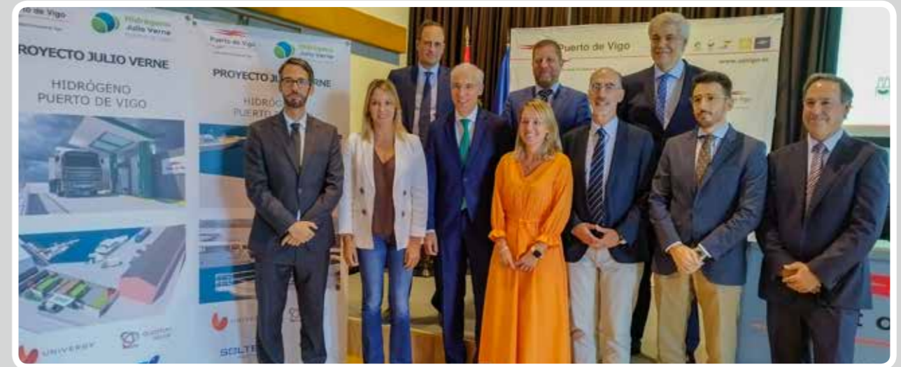
Presentación oficial del proyecto Blue Growth "Julio Verne", que permitirá disponer en el Puerto de Vigo de la primera estación pública de Galicia de hidrógeno verde. Official presentation of the Blue Growth "Julio Verne" project, which will make it possible to have the first public green hydrogen station in Galicia in the Port of Vigo.