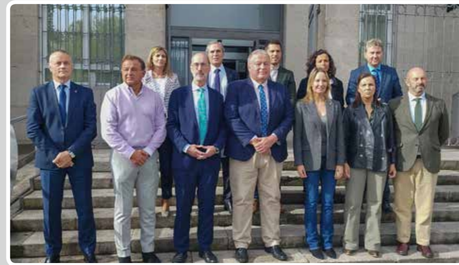
La Comisión de Transportes del Grupo Parlamentario Popular en el Senado visita el Puerto de Vigo.