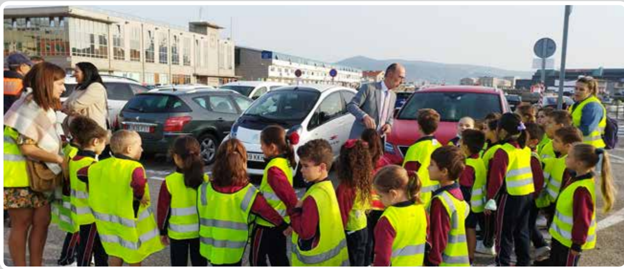
Visita al Puerto de Vigo de alumnos del colegio Santa Cristina. Visit to the Port of Vigo by students from the Santa Cristina school.