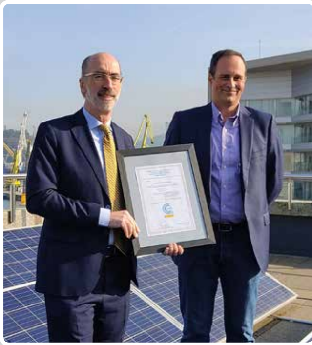
Registro de la Huella de Carbono del Puerto.