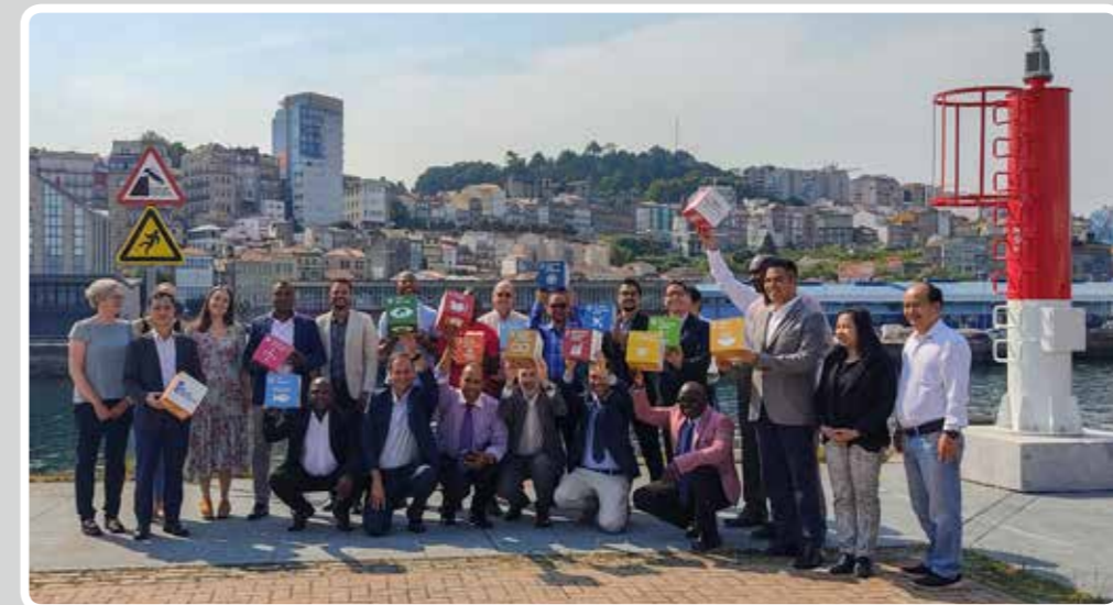
El Puerto de Vigo se suma al Pacto Mundial de Naciones Unidas.