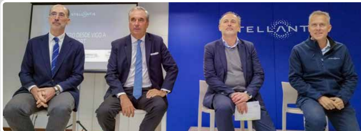
Stellantis pone en marcha un nuevo flujo de aprovisionamiento desde Vigo a la planta de Ellesmere Port a través del Puerto de Vigo.