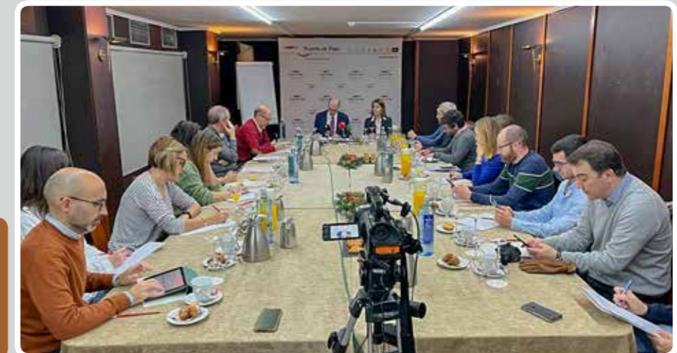
Desayuno informativo con los medios de comunicación.