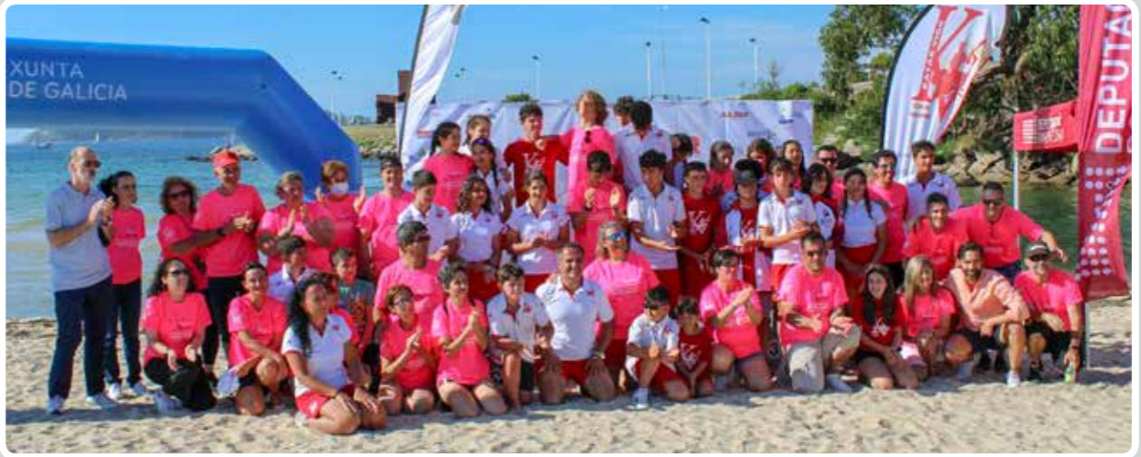
Entrega de premios de la III Copa España de Kayak de Mar. III Spanish Sea Kayak Cup awards ceremony.