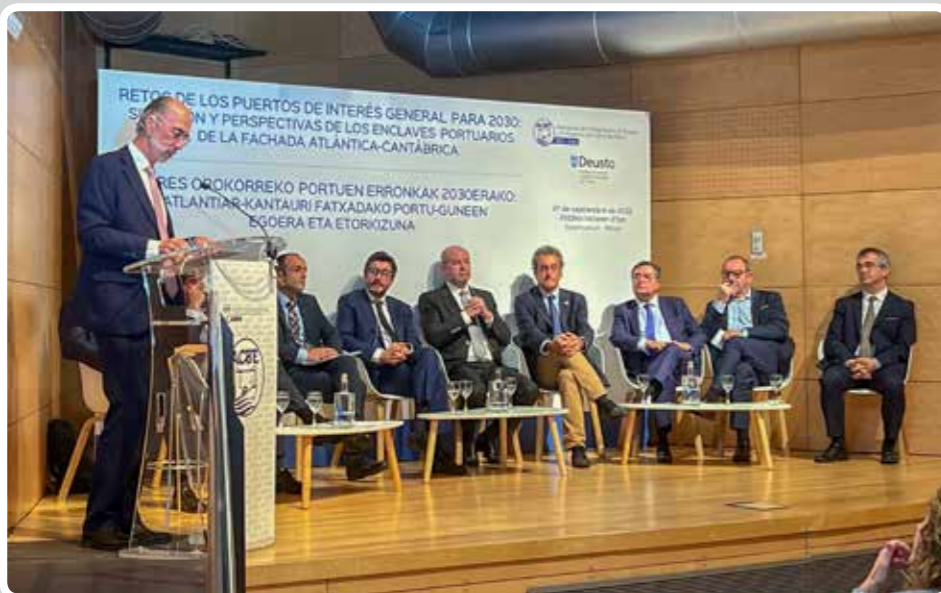
El Puerto de Vigo participa en el centenario de la Asociación de Consignatarios y Estibadores (ACBE) de Bilbao. The Port of Vigo participates in the centenary of the Association of Shipping Agents and Stevedores (ACBE).