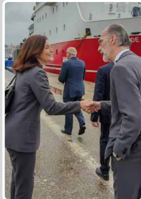
Visita al Puerto de Vigo de la secretaria general de Investigación del Gobierno, Raquel Yotti. Visit to the Port of Vigo by the general secretary for government research, Raquel Yotti.