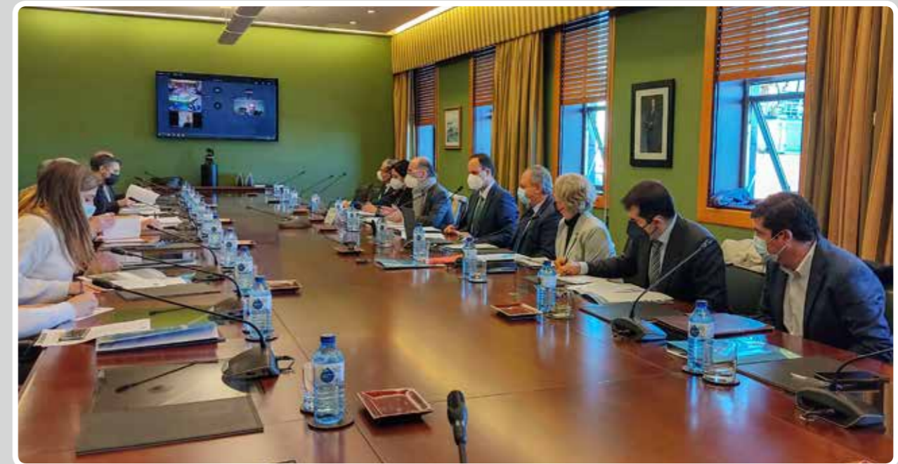
Reunión de la Comisión Blue Growth de construcción naval. Meeting of the Blue Growth Shipbuilding Commission.