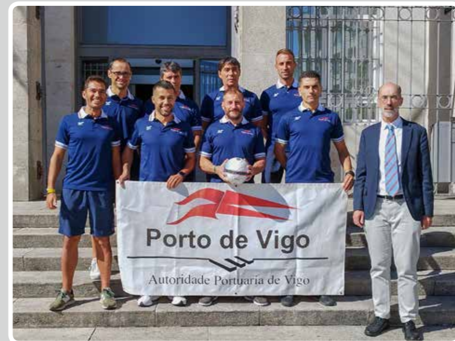
El Puerto de Vigo participa en el 25º Campeonato Interpuertos de fútbol sala. The Port of Vigo participates in the 25th Futsal Interport Championship.