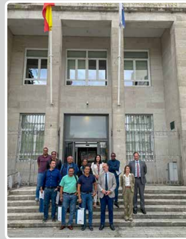
El Puerto de Vigo acoge la visita de una delegación de Cabo Verde. The Port of Vigo hosts the visit of a delegation from Cape Verde.