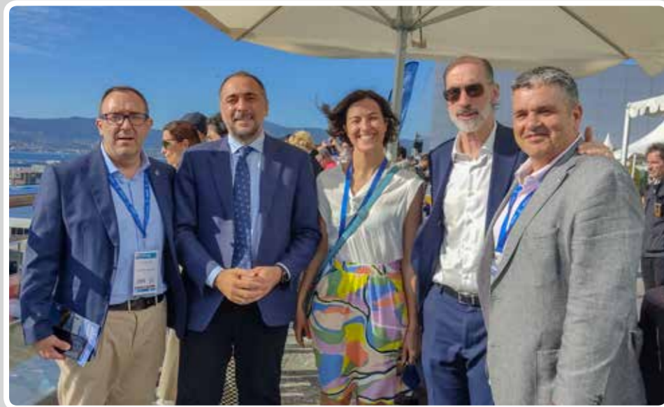
El Puerto de Vigo acoge un simulacro de accidente marítimo-terrestre. The Port of Vigo hosts a maritime-land accident simulation.