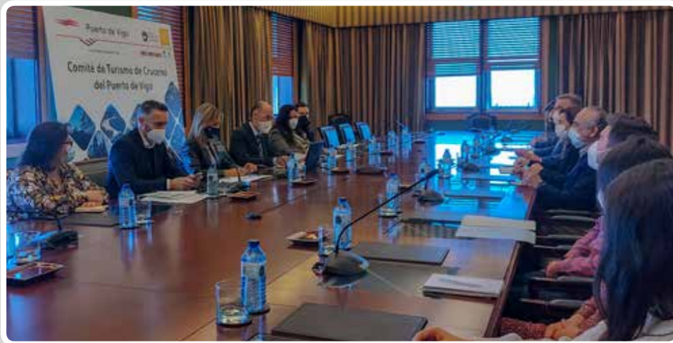
Reunión del Comité de Turismo de Cruceros del Puerto de Vigo. Meeting of the Cruise Tourism Committee of the Port of Vigo.