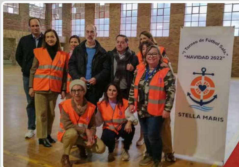
First edition of the Futsal Tournament organized by the Stella Maris Marine Centre, in collaboration with the Vigo Port Authority.