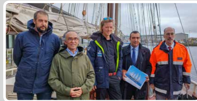
El buque escuela "Regina Maris" recaló en el Puerto de Vigo.