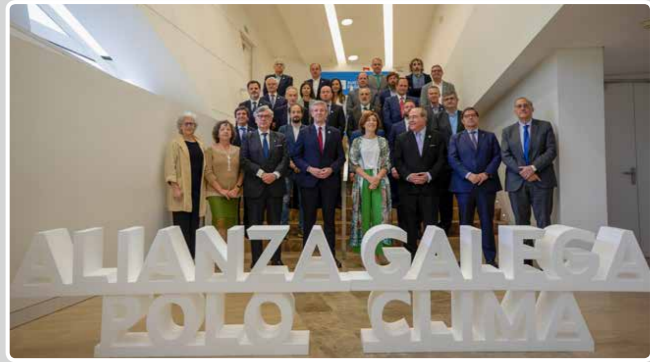
El Puerto de Vigo se adhiere a la Alianza Galega polo Clima, confirmando su apuesta por la sostenibilidad. The Port of Vigo adheres to the Galician Alliance for the Environment, confirming its commitment to sustainability.