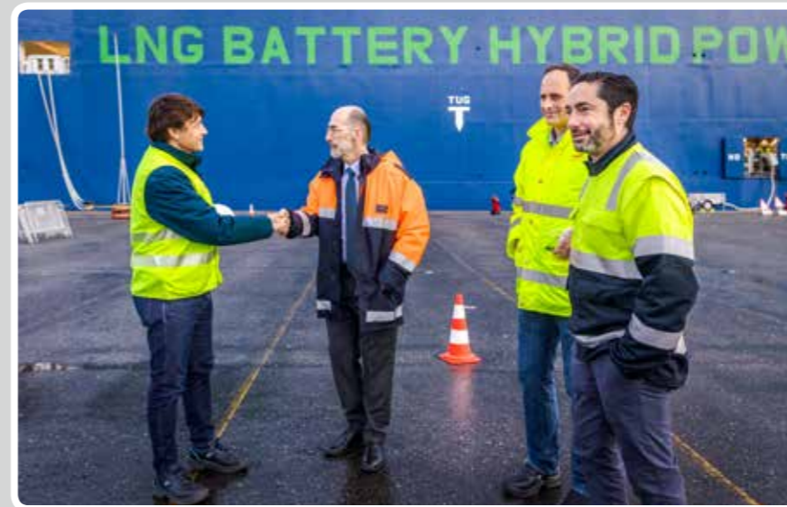
El Puerto de Vigo acoge la primera carga en España de Gas Natural Licuado como combustible marino.