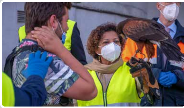
El Puerto de Vigo recibe la visita de una delegación del Ministerio de Pesca de Mozambique.