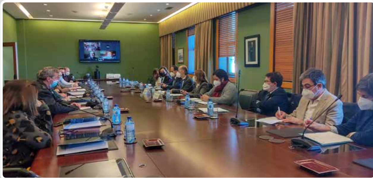
Reunión del Comité de Bienestar portuario. / Meeting of the Port Well-being Committee.