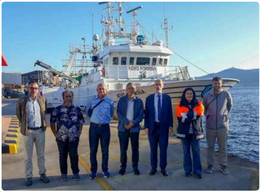
El Puerto de Vigo recibe la visita de una delegación del Gobierno indonesio. The Port of Vigo receives a visit from a delegation from the Indonesian government.