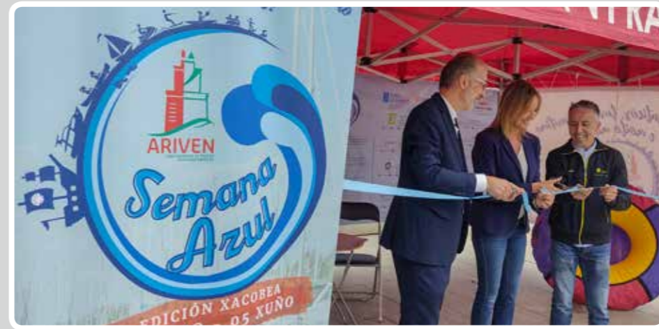
Inauguración de la Semana Azul de la Asociación Ría de Vigo de Entidades Náuticas (ARIVEN). Inauguration of the Blue Week of the Ría de Vigo Association of Nautical Entities (ARIVEN).