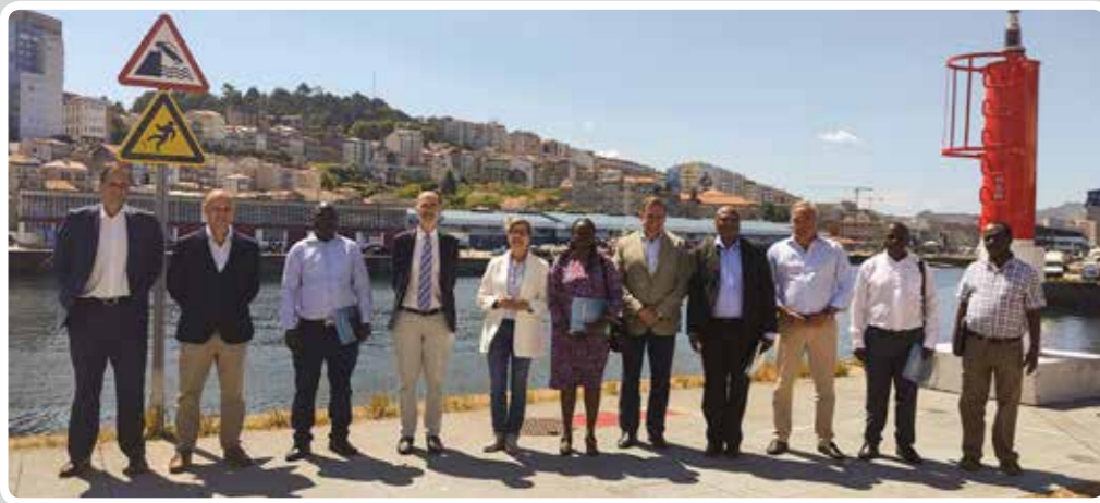
Una delegación de Kenia visita el Puerto de Vigo. A delegation from Kenya visits the Port of Vigo.