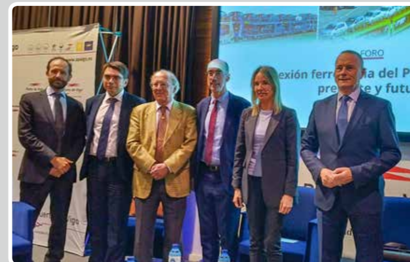
El Puerto de Vigo acoge con gran éxito un foro sobre el presente y el futuro de la conexión ferroviaria.