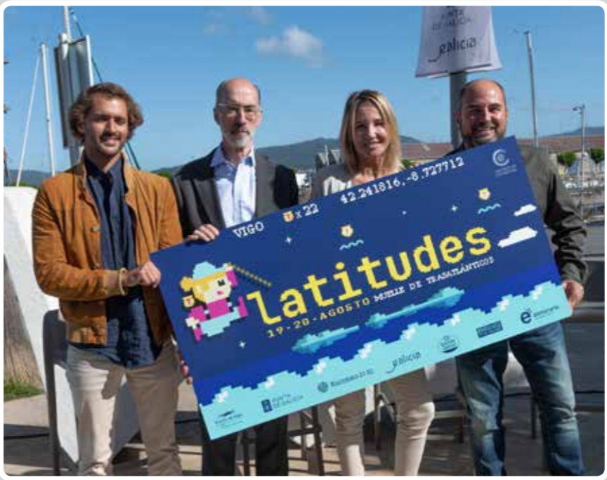
El Puerto de Vigo acoge el "Festival Latitudes" con la presencia de grandes estrellas del rock. The Port of Vigo hosts the Latitudes Festival with the presence of great rock stars.