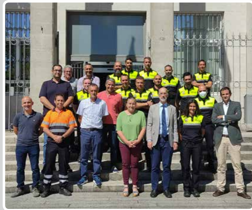
Agradecimiento a los trabajadores de la APV que colaboraron en los actos organizados con motivo del Día del Carmen. Thanks to the Vigo Port Authority workers who collaborated in the events organized for Día del Carmen.