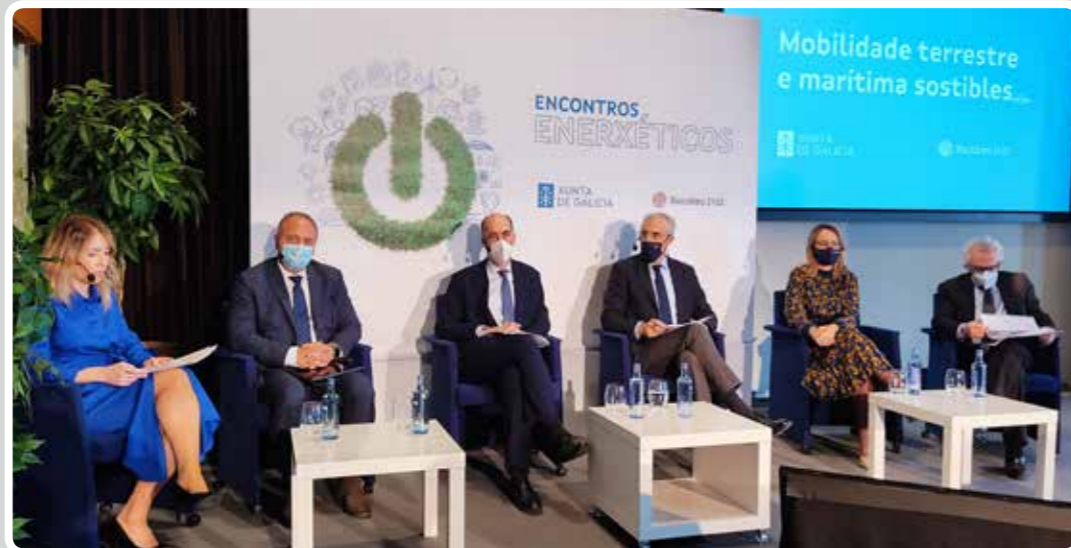
El Puerto de Vigo acoge un encuentro energético de la Xunta de Galicia sobre movilidad sostenible.