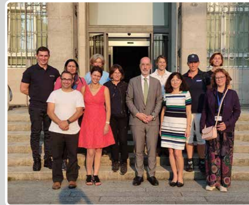
Una delegación de la DG Mare visita el Puerto de Vigo.