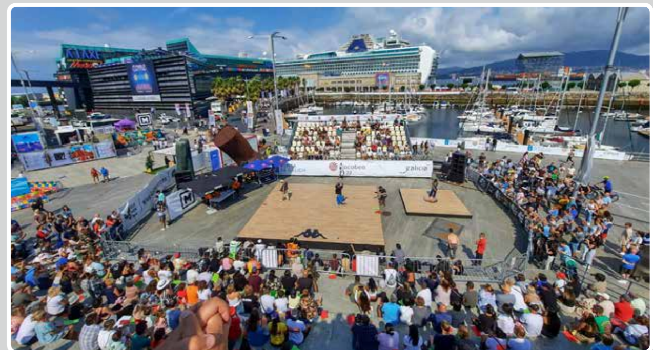
El Puerto de Vigo acoge una nueva edición de O'Marisquiño.