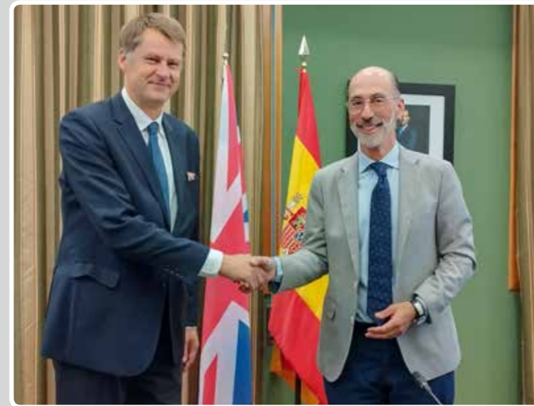
Una delegación de la embajada británica en España, encabezada por el embajador, Hugh Elliott, visita el Puerto de Vigo. A delegation from the British Embassy in Spain, led by the ambassador, Hugh Elliott, visits the Port of Vigo.