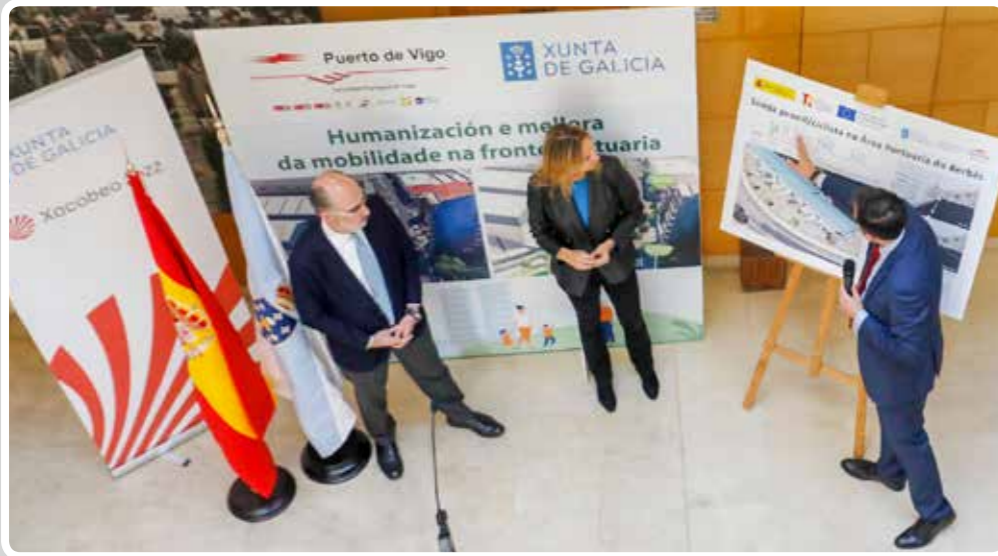
Puerto de Vigo y Xunta de Galicia proyectan una senda peatonal y ciclista en la zona portuaria de El Berbés.