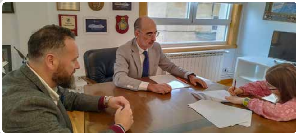
El Puerto renueva su compromiso con la Asociación Down Vigo.